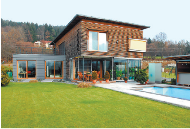
Im eingeschossigen Gebäudeteil (links) ist das Büro mit separatem Hauseingang untergebracht