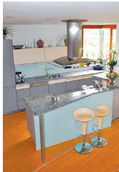
Die Kochinsel mit Granitplatte hat die Hausherrin selbst geplant. Wichtig: der freie Blick hin zum offenen Wohnraum

„Diesen Aufgang hat er sich in den Kopf gesetzt“, sagt Kofler, die sich mittlerweile auch damit anfreunden konnte. „Wir haben die Treppe mittlerweile schon fünfmal für Kunden nachgebaut“, ist der Hausherr stolz.