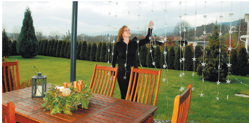
Fließende Übergänge zwischen offenem Wohn-Essraum und der überdachten Terrasse mit Pool

Jede Menge Glas und Transparenz über zwei Geschosse sorgen für viel Sonnenlicht in den Räumen. Wärme strahlt auch der geölte Ahorn-Parkettboden aus. Das Tüpfelchen auf dem i ist aber der freitragende Stahlkamin. Er lässt sich um 360 Grad drehen. Prin-