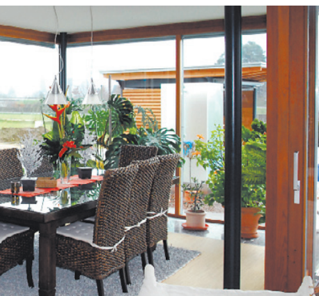
Die Platte des Esstisches war einmal ein marokkanisches Türblatt